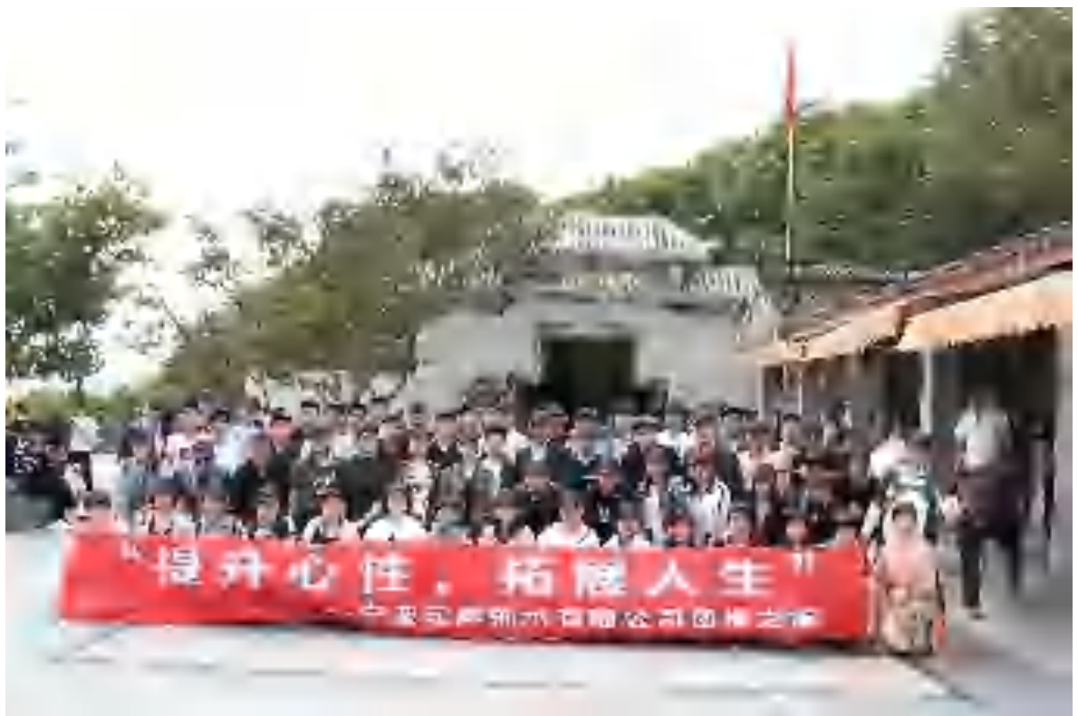
图6.2-2 b) 集体旅行