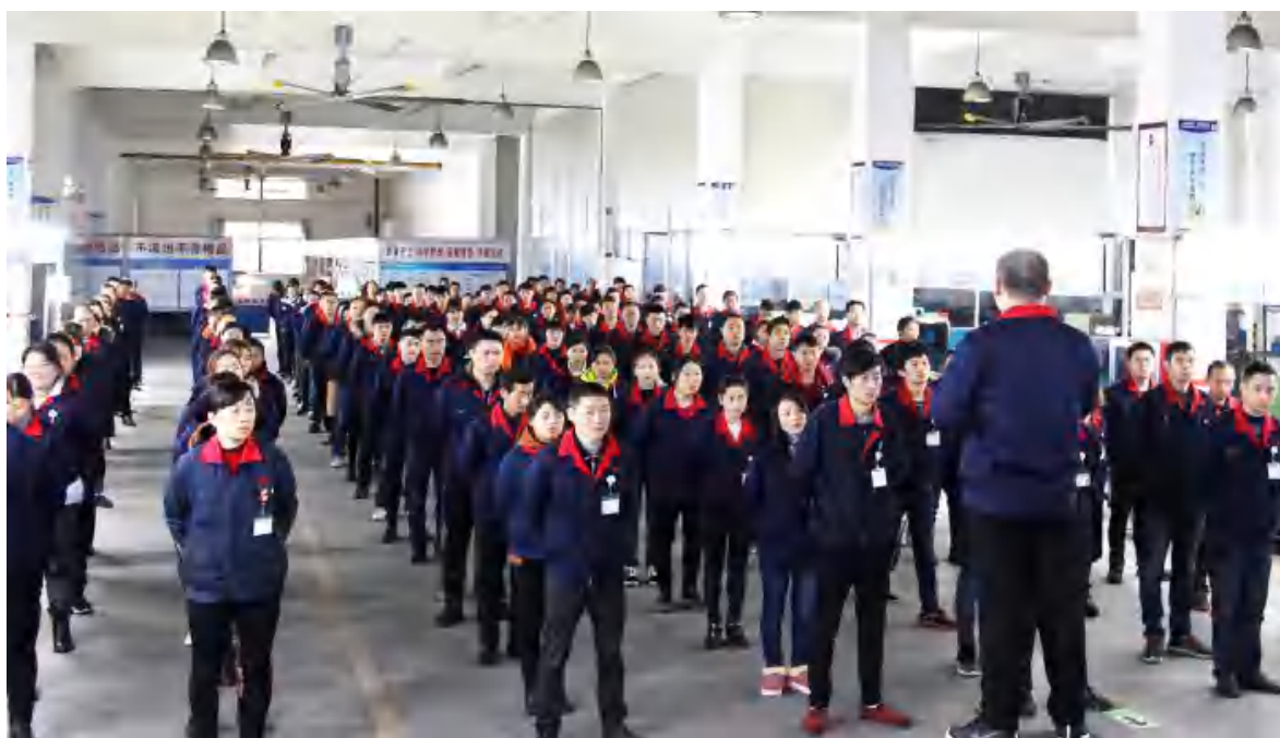
图表2.1-5 全体员工早会