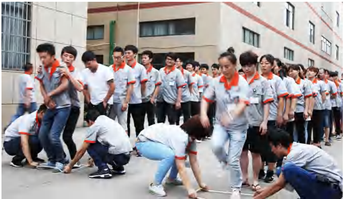
图6.2-2 c) 团体活动