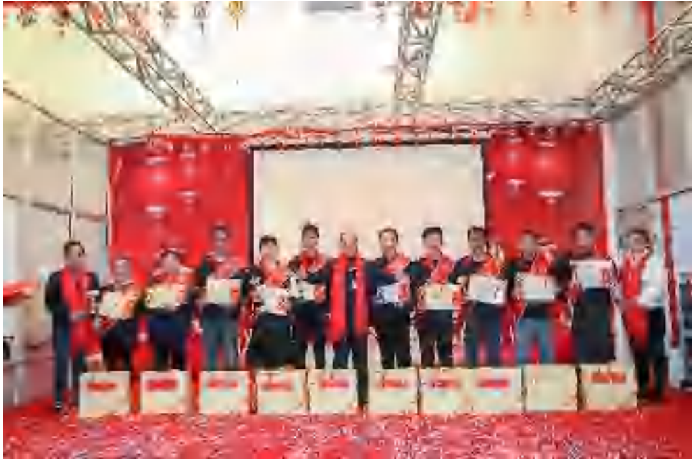
图表2.1-8 优秀员工表彰