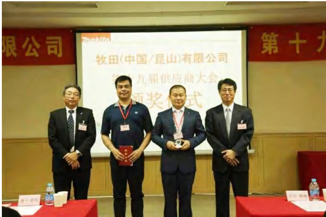
图表2.1-7 优秀供应商颁奖大会