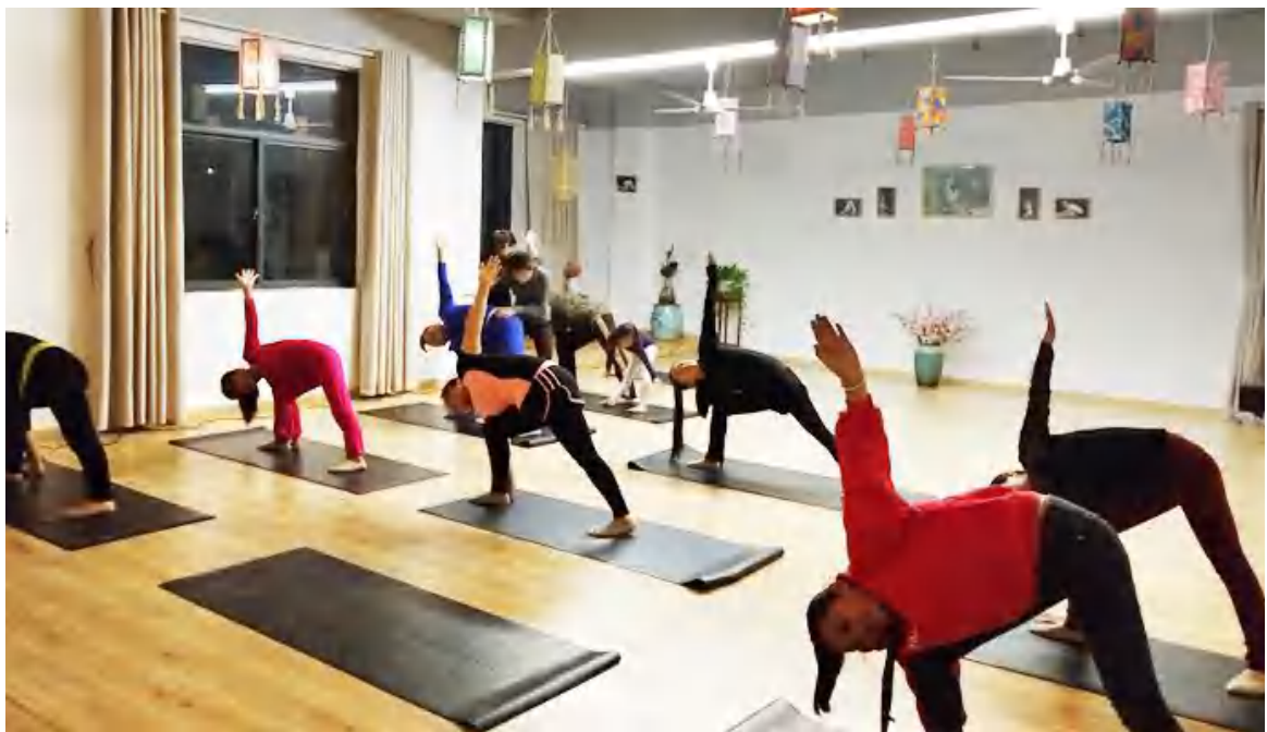
图6.2-2 a) 瑜伽

公司也十分重视职工群众的身心健康，工会牵头成立兴趣小组，积极开展活动，并组织员工技能比拼、运动会等活动。职工可以根据自己的爱好特长和情趣，展示自己的才华，充实精神生活，既活跃了职工的精神生活，也增强了企业的向心力和凝聚力。