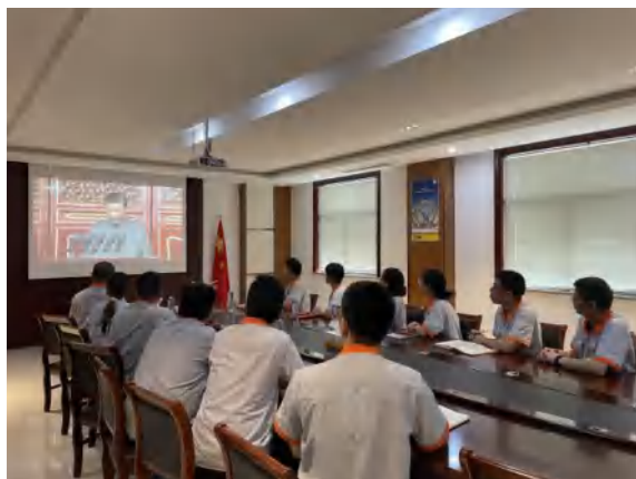
图6.5-1 职工培训交流会议

工反映的问题进行认真地调查并通过职工代表大会、工会等方式进行讨论、研究，给予解决和答复，使广大员工感受到自己是企业的主人，企业是自己的家。为使员工了解企业的经营情况、发展战略、改革措施等重大事项，搭建员工与高层管理人员的有效沟通平台和渠道。公司工会制定了员工定期座谈会管理办法，每月设定员工接待日，听取员工对公司发展过程中的意见和建议及员工最关心、最直接的问题和意见，解答员工的疑问。